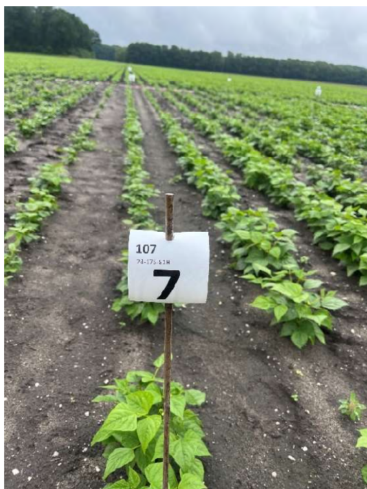
Veld 107 (Object 7 ) op 2 juli 2024: