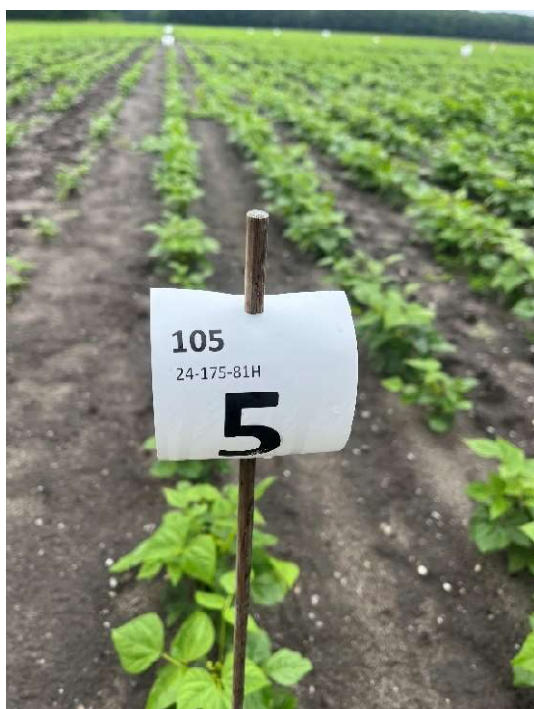
Veld 105 (Object 5) op 2 juli 2024: