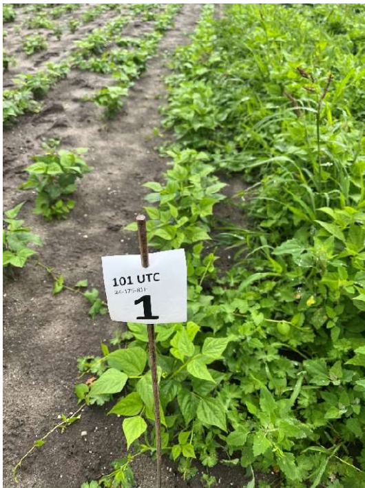
Veld 101 (Onbehandeld) op 2 juli 2024: