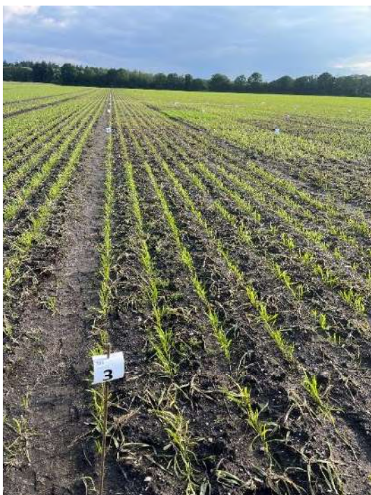
Veld 103 (Object 3) 30 mei 2024: