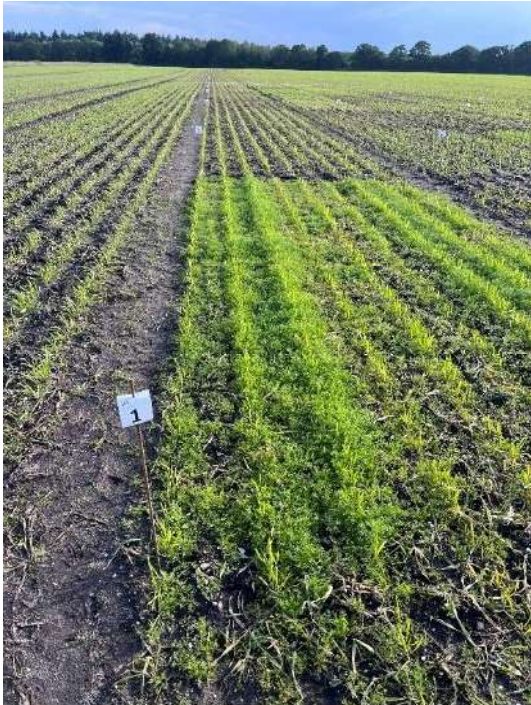
Veld 101 (Onbehandeld) op 30 mei 2024: