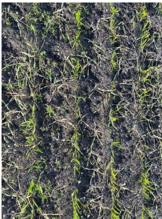
Veld 104 (Object 4) op 30 mei 2024: