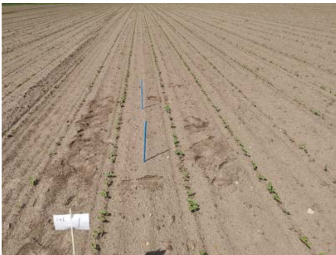
Figuur 6 perceel 2 object 1 gangbaar, 24-07-2025