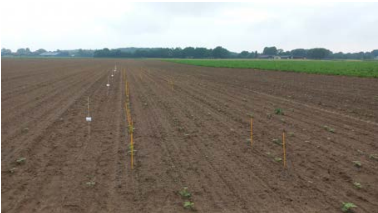
Figuur 2 Perceel 1 gangbaar object 1, 26-06-2025, grote verschillen tussen object 1 en 2 (zie figuur 1) mogelijk spelen andere perceel invloeden ook een rol.