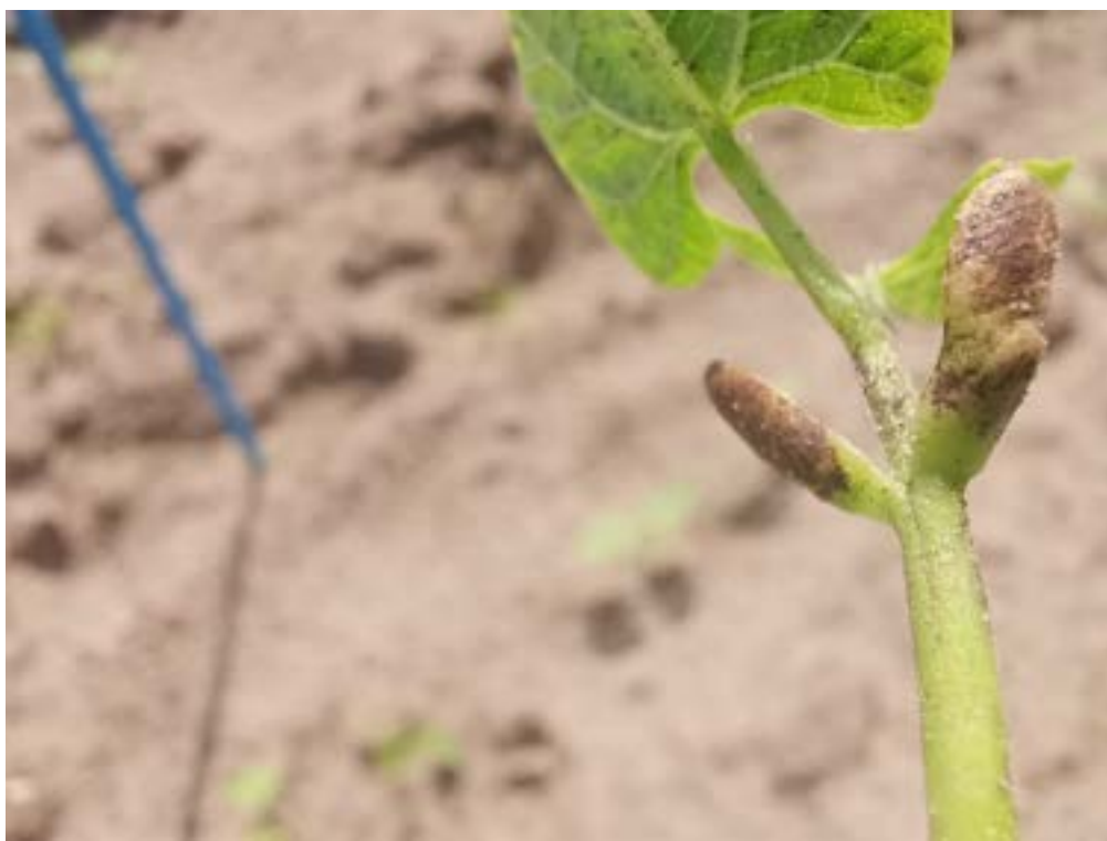
Figuur 3 perceel 2 object 1 detail foto gangbare teelt, 24-07-2025