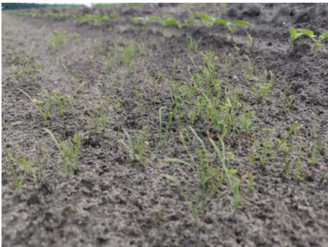
Figuur 5 perceel 2 object 2 detail foto kruidvenkel intercropping, 24-07-2025