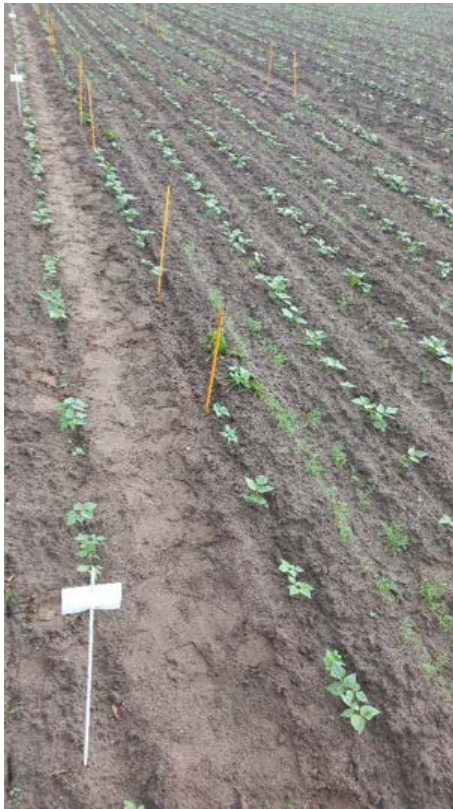
Figuur 1 Perceel 1 kruidvenkel intercropping object 2. 26-06-2025