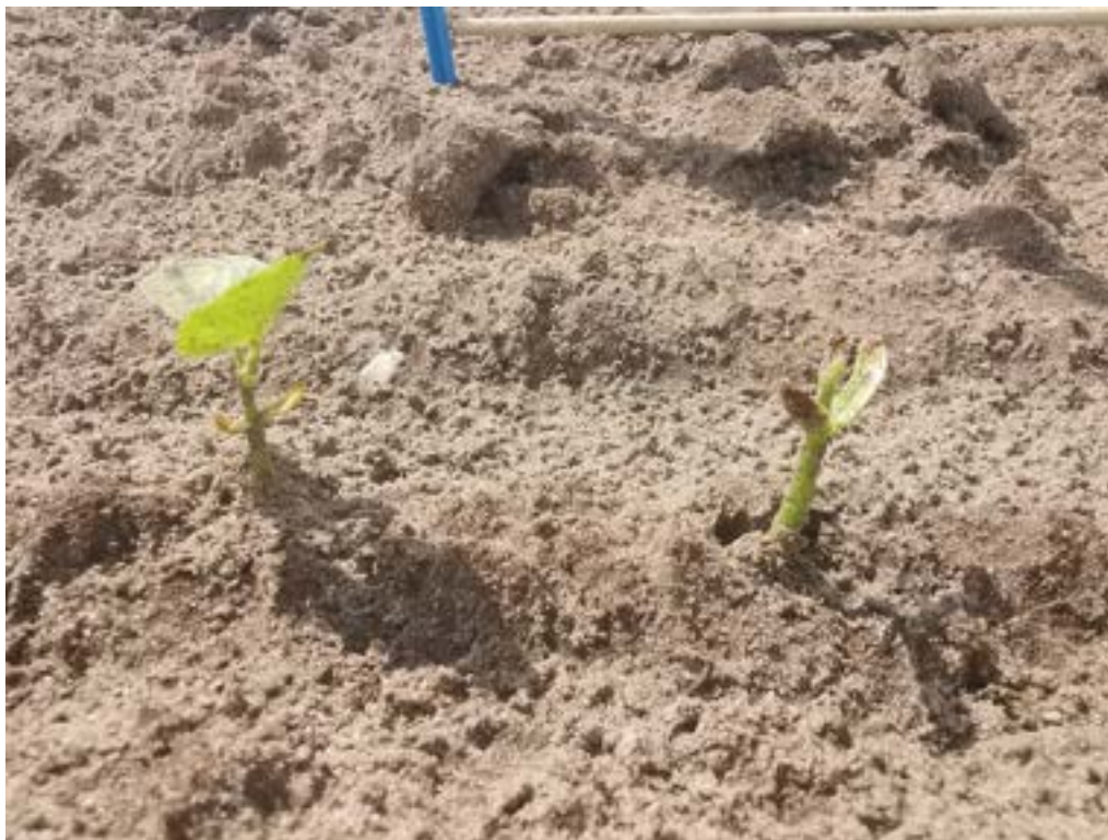
Figuur 4 perceel 2 object 1 detail foto gangbare teelt, 24-07-2025