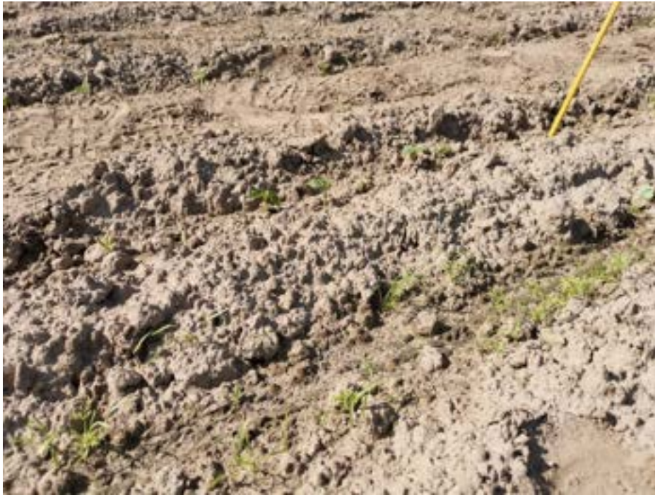
Figuur 7 Perceel 1 kruidvenkel behandeling intercropping en sperziebonen teelt, 12-6-2025