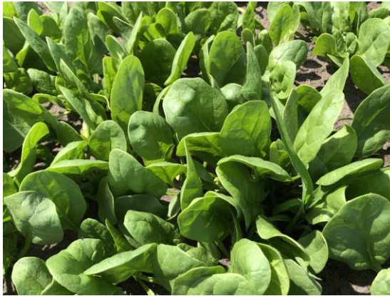
Onkruidbestrijding in spinazie