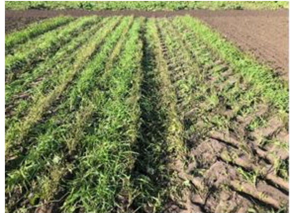
Vanggewas staat nog na oogst bonen